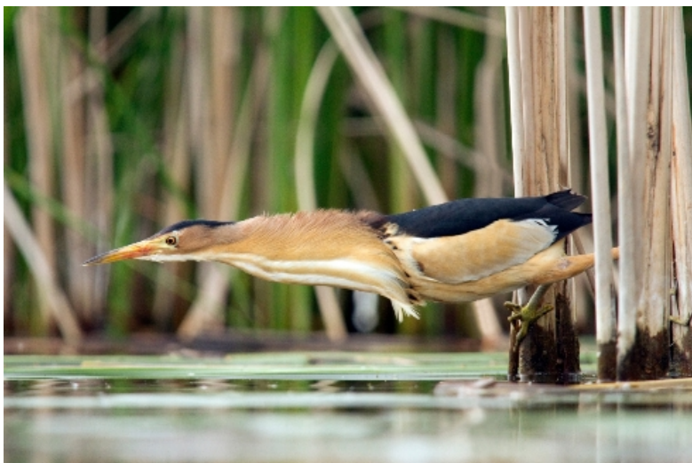
Walczący z grawitacją , autor: Hubert Gajda