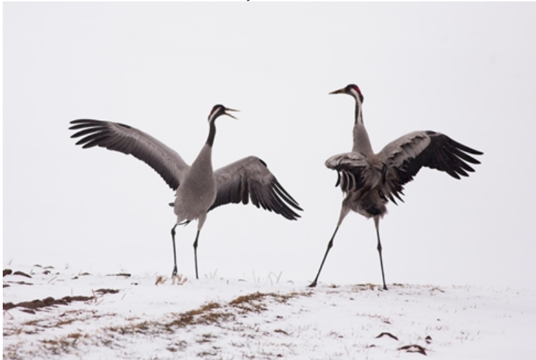
Taniec na śniegu , autor: Tomasz Stasiak