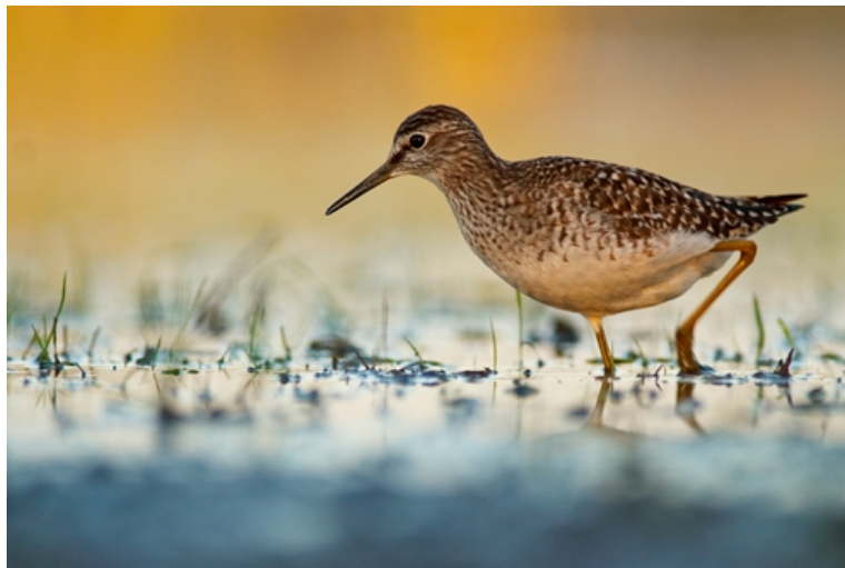
Poranny żer , autor: Marcin Dobrychłop