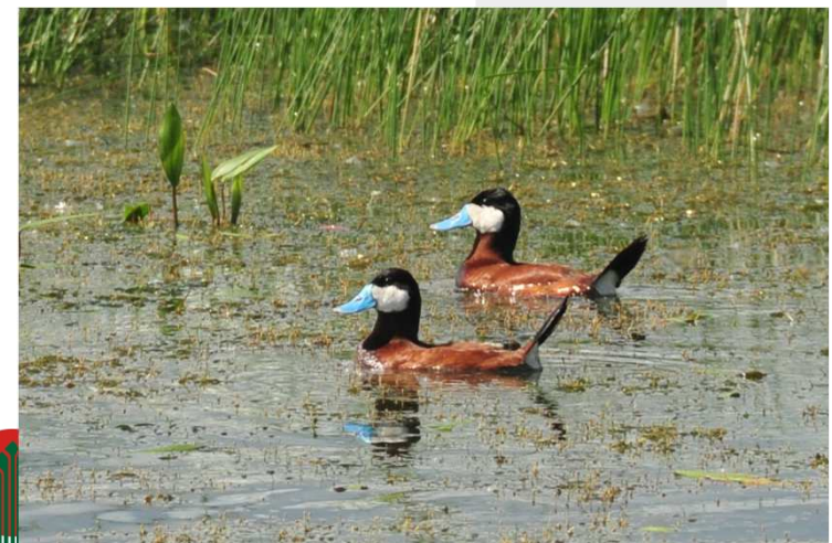
Fot. Sterniczki jamajskie (Tom Koerner, Wikimedia Commons)