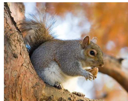
Wiewiórka szara

Zezwolenie może wydać odpowiednio: Generalny Dyrektor Ochrony Środowiska (GDOŚ) lub właściwy regionalny dyrektor ochrony środowiska (RDOŚ)