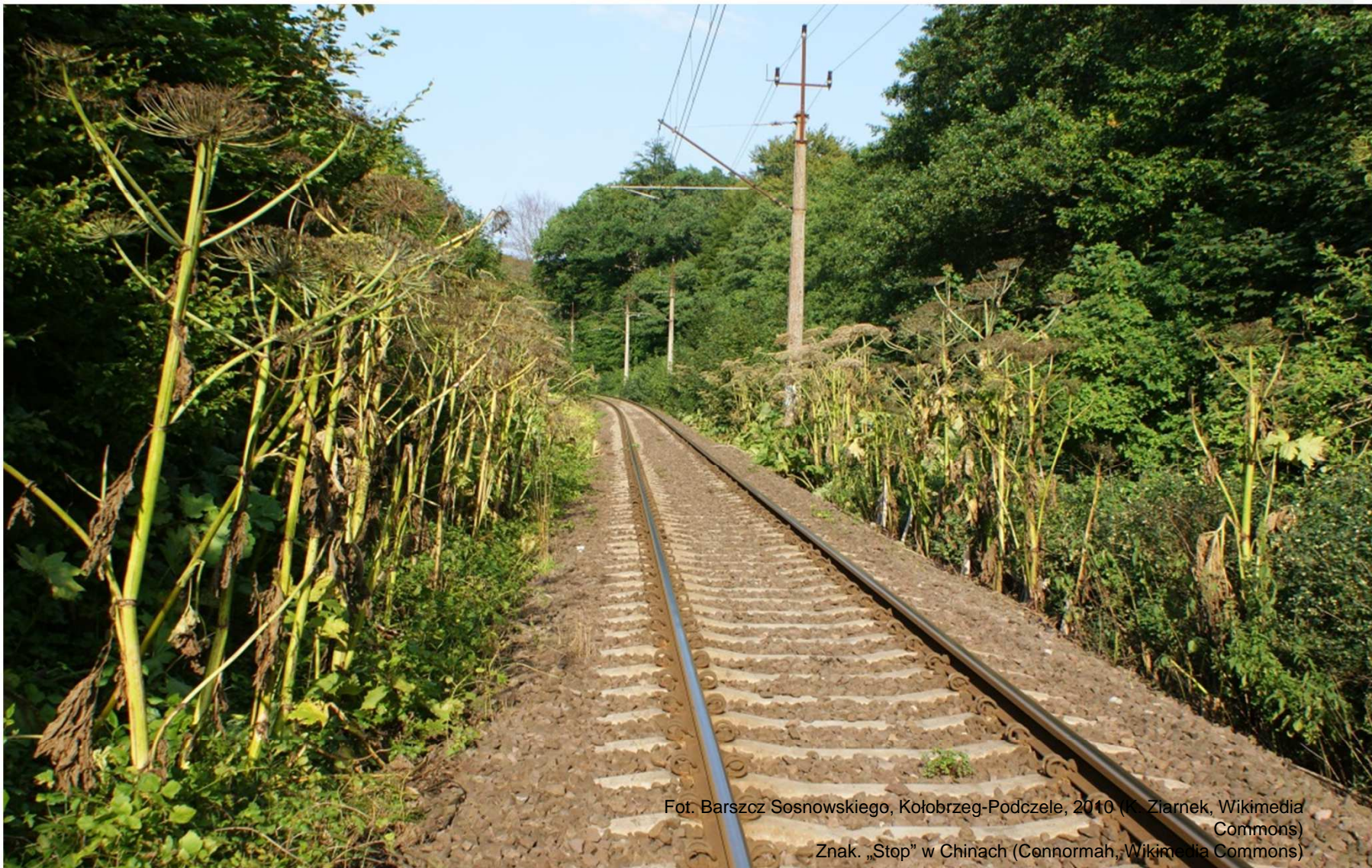
Fot. Barszcz Sosnowskiego, Kołobrzeg-Podczele, 2010 (G. Ziarnek, Wikimedia Commons)