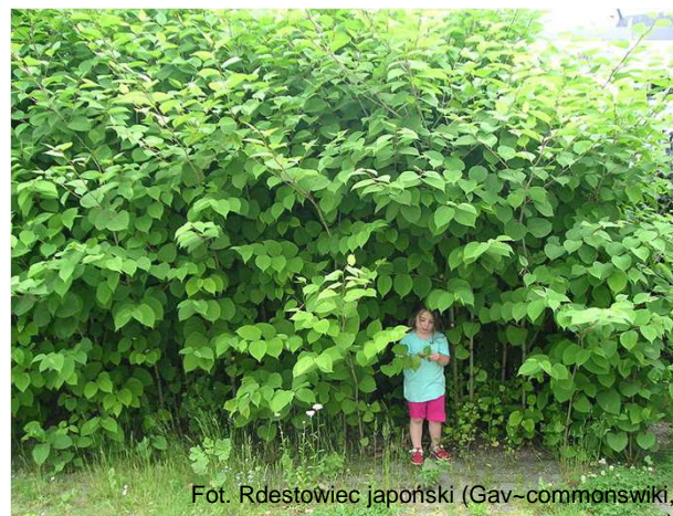
Fot. Rdestowiec japoński (Gav~commonswiki, Wikimedia Commons)

RDOŚ może zarządzić na koszt skazanego uśmiercenie zwierząt lub zniszczenie roślin lub grzybów gatunków obcych stanowiących własność sprawcy. (art. 130 ust. 4 uop)