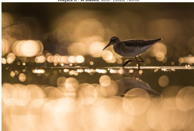
Miejsce III - Odłot , autor: Michał Kość

Miejsce II - W blasku , autor: Łukasz Tworek