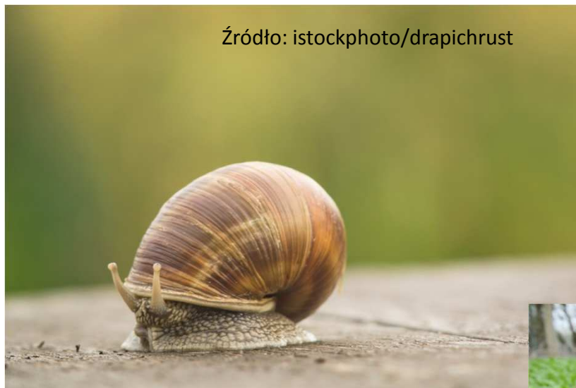
Ślimak winniczek ( Helix pomatia )