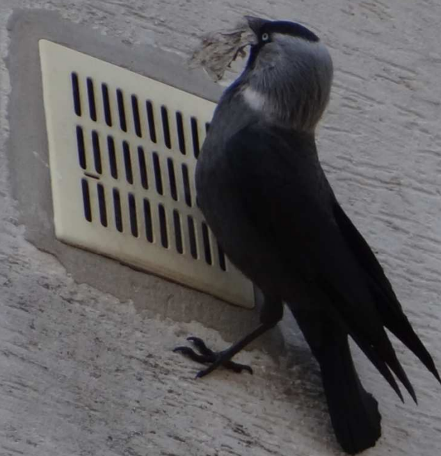
kawka ( Corvus monedula )