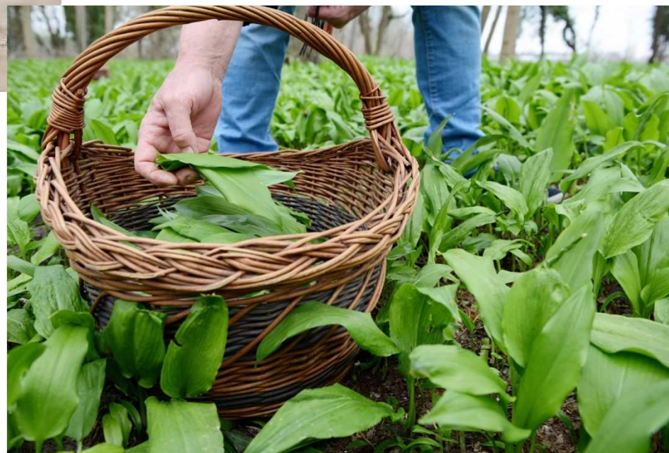
Czosnek niedźwiedzi ( Allium ursinum )